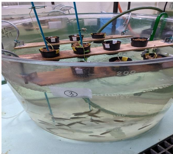
タモロコと枝豆の閉鎖循環型水槽

当社はIoT 技術、遠隔観察技術、ソフトウェアによるデータの分析など、IT を活用し、効率よく詳細な育成環境の制御を行えるシステムを確立することを目指しています。