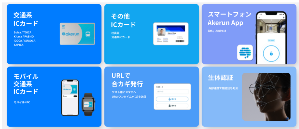
Akerun 入退室管理システムの利用イメージ