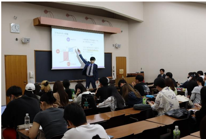
井口による講義の様子