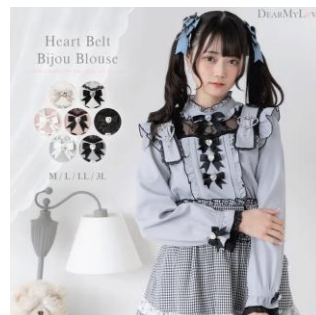
量産型ガールースタイル