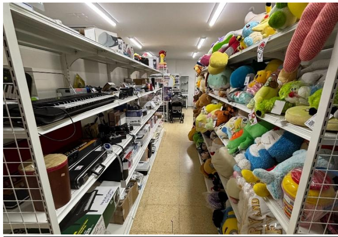
「ジモティースポット坂戸店」の店内写真