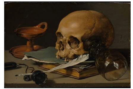
Pieter Claesz 《Still Life with a Skull and a Writing Quill》