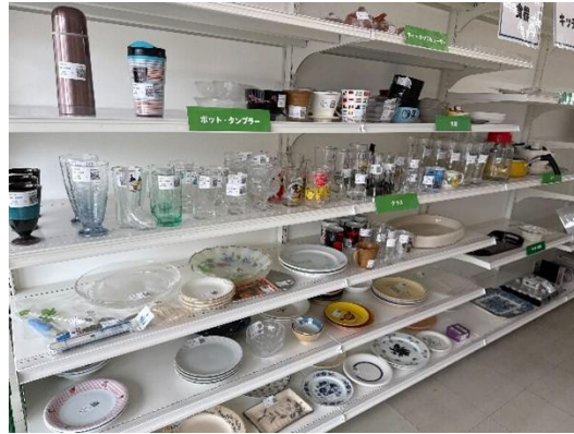
ジモティースポットの様子(写真はジモティースポット札幌白石店)