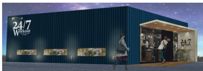
※フリスタの「24/7SPORTS CLUB」外観イメージ

2024 年 12 月からスタートした「24/7Pilates（パーソナルピラティス）」の業績が好調であったことから、「24/7SPORTS CLUB」という総称屋号をつくり、24/7Workout と 24/7Pilates を組み合わせた店舗やそれらに 24/7FiT を組み合わせた 3 業態を併設した店舗をビルインにて出店しました。また、NOVA ホールディングスグループが展開する学習塾のフリースタANDING（以下、「フリスタ」といいます。）のノウハウを活用したロードサイド型の 3 業態を併設した「24/7SPORTS CLUB」を下半期に出店しました。