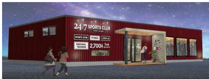
※2026年11月期に計画しているフリスタの外観イメージ

2025年11月期の下半期に出店した「FiT」「Workout」「Pilates」の3サービスを提供する24/7SPORTS CLUB、特にフリスタの同業態の立ち上がりが好調に推移しております。2026年11月期はフリスタの直営店舗を複数出店し、マーケティング手法やオペレーションを確立させ、事業性の高いモデル店舗づくりに重点をおきます。この土台作りを行うことにより、2027年11月期以降の店舗数拡大につなげていきます。