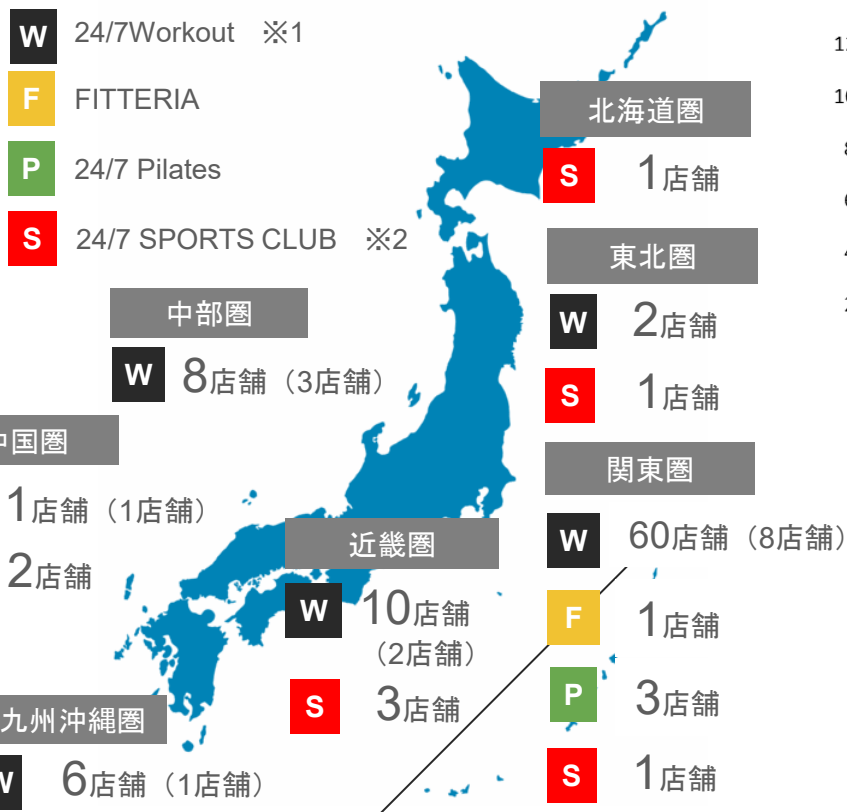
現在の地域別国内店舗網（2025年11月末）

24/7SPORTS CLUB茨木店（2025年9月）、24/7Pilates大宮門街店（2025年11月）