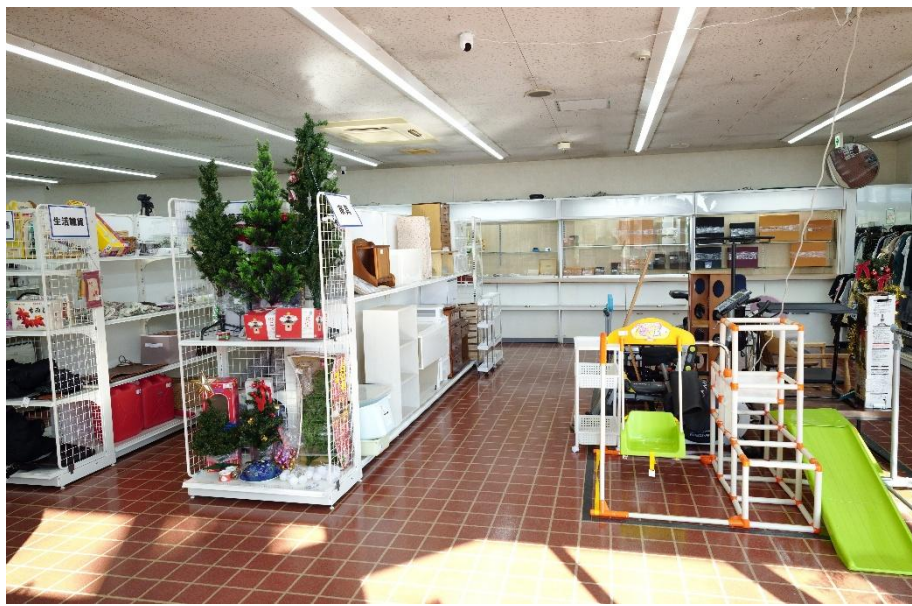
「ジモティースポット松山久万ノ台店」店舗内