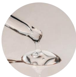
高純度スクワラン