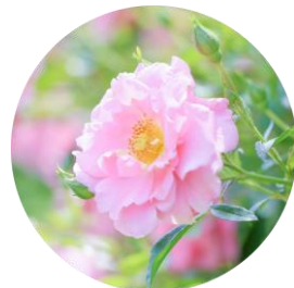
センチフォリアバラ花エキス (幸福感へアプローチ)