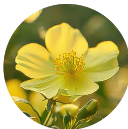
メマツヨイグサ種子エキス