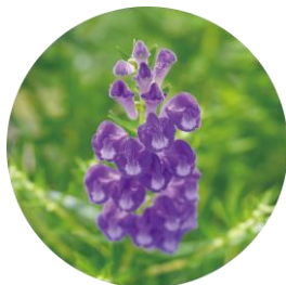
オウゴン根エキス