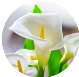
カラー花酵母エキス* (乾燥ストレスにアプローチ)