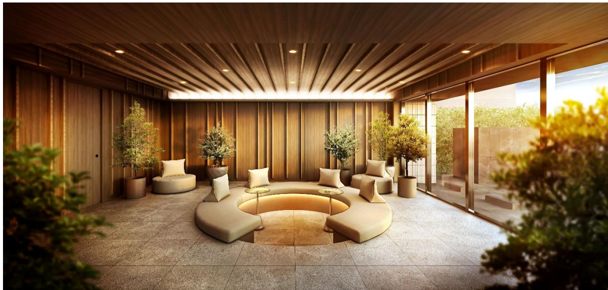
エントランスホール完成予想CG

共用部は内廊下設計とし、各住戸専用の宅配ボックスを設置。さらに、建物内すべての蛇口から出る水にはウルトラファインバブルを導入し、洗浄効果や節水効果の向上を図っています。