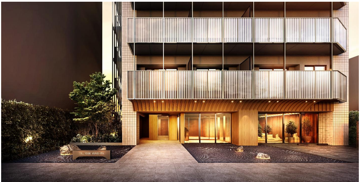
エントランスアプローチ完成予想CG

当社が東京都江東区において販売しておりました新築分譲マンション『ウィルローズ森下』につきまして全戸契約完売しましたので、お知らせいたします。