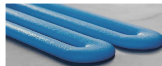
放熱ギャップフィラー