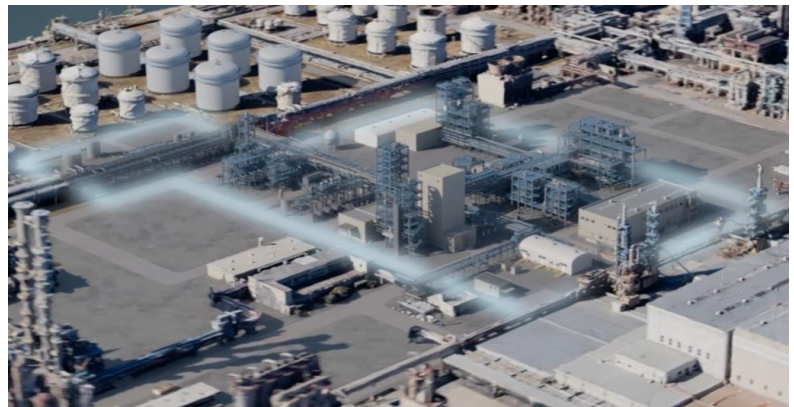
大型パイロット装置完成 CG イメージ