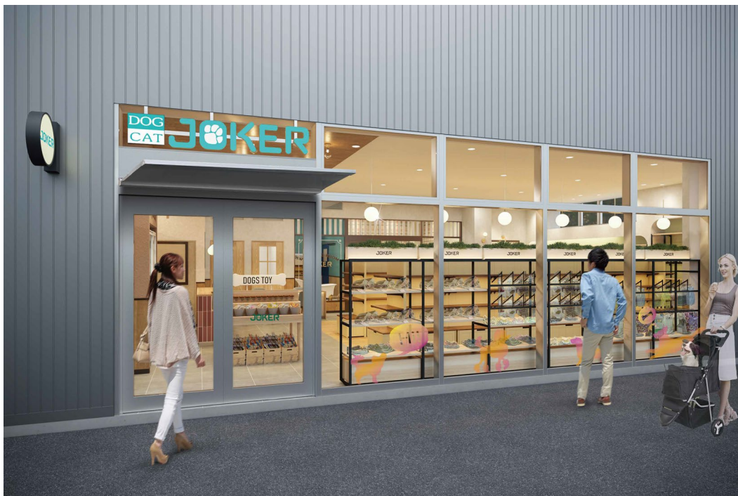
【DOG&CAT JOKER フォレストスクエア仙川店イメージ図】