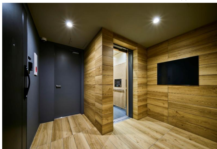
1F エレベーターホール