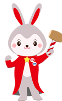
日本M&Aセンター 上市支援サービスキャラクター TIPPY☆ジ ティッピー

ハートアップは、日本 M&A センターが担当 J-Adviser として TOKYO PRO Market への上市申請を行う第 53 号銘柄です。