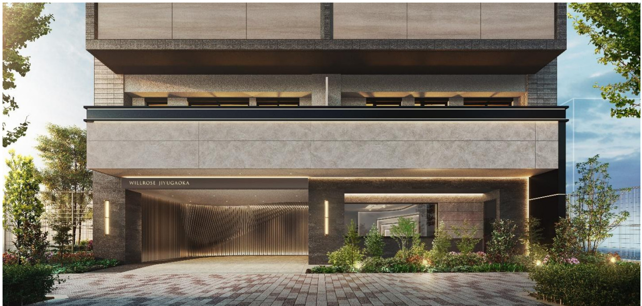
エントランスアプローチ完成予想CG

当社が東京都世田谷区において販売しておりました新築分譲マンション『ウィルローズ自由が丘』につきまして全戸契約完売しましたのでお知らせいたします。