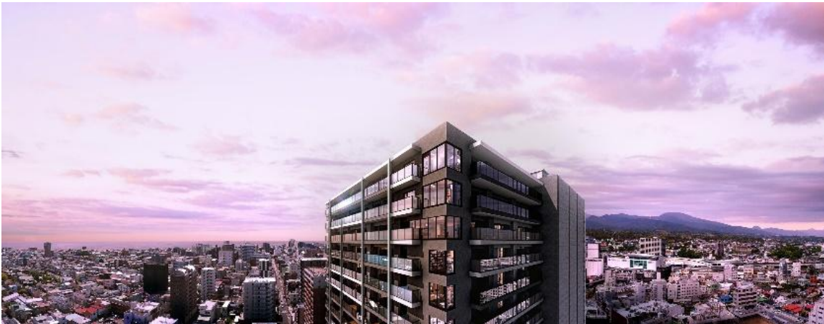
▲眺望合成外観完成予想CG ※4

小田原市内の分譲マンションにおいて「最高階層（19階建）」かつ「最大戸数（286邸）」を誇る圧倒的なスケールを実現。小田原城の天守閣に迫る高層レジデンスとして、地域の新たなシンボルとなる存在感を目指しました。全方位に美しいデザインと、二層吹き抜けの荘厳なエントランスホールが住まう方の誇りを満たします。最大の魅力となる上層階の眺望からは、雄大な相模湾のオーシャンビューや、歴史を感じる小田原城郭、そして四季折々の表情を見せる箱根連山を一望できます。 ※3