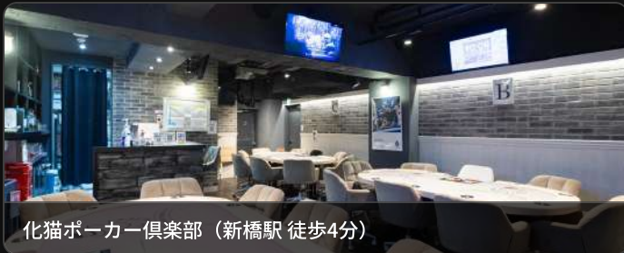
化猫ポーカー倶楽部（新橋駅 徒歩4分）