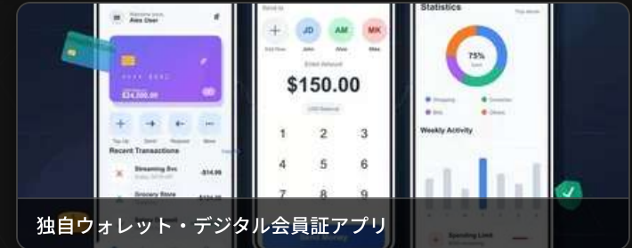
独自ウォレット・デジタル会員証アプリ