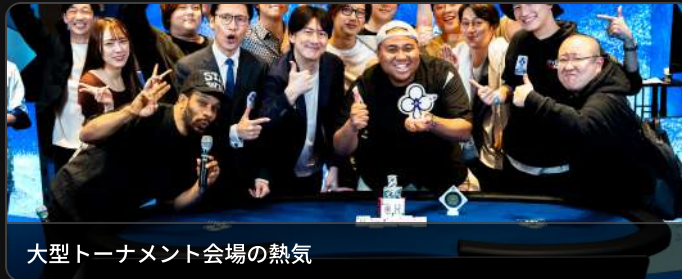
大型トーナメント会場の熱気