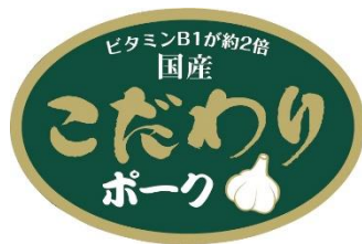
旧販促シールデザイン

買い物の途中で、「今日は少し疲れているから」「家族に、元気につながる食事を用意したいから」そんな気持ちに寄り添い、売場で目にした時に、思わず手に取りたくなるわかりやすい表現を目指します。