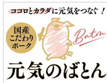
親しみやすい新キャラクター「はぴとん」を全面に打ち出した新販促シール