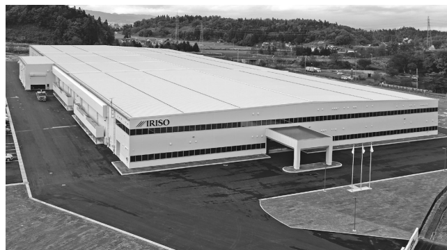
2025年4月 秋田工場稼働開始